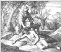
Притча о милосердном самарянине

жениства, насими, грешения, лужкаства... Не укреплены бы были клеветы, лести, злотицы; не потресны бы были сторожа, запоры, замки; не было бы плачущих и кровавые слезы проливающих, насильных людей; не слышались бы жалобные гласы вдов, сирот и прочих беззастенчивых на него конвоцих... Но любовь не допущала бы до сих и подобных бедствий... Сказати невозможно, коль великое благополучие любовь приносит во всяком чине, между начальником и подначальными, между родителями и детьми; между мужем и женою, между братьями и сестрами; и соседстве между гражданами... Без любви нет ни где радости и утехи: где любовь, там всегдашний духовный мир и анконание. Любили связанными душами и в темнице сидеть приятно, слезы друг о друге проливать сладостно; без любви и красивые чертоги не отапливаются от теплицы. С любовью хлеб и вода сладко вкушается; без любви и сладкая пища горькою выкалет... Любили дома, города, государства стоят; без любви падает... Любовь единство укрепляет, краю страшными и непоседливыми делет. О, блаженно то общество, тот город, тот дом, в котором взаимная процветает любовь! Раю земному, радости и сладости испованному, подосно место, в котором любовь, как дерево сладким паданом изобильное пресыщает. О любовь, любовь, неценное сокращение, любовь! всех благ матерь, любовь! известное живой веры знамение — христианская любовь! Сколько бед, напастей и зол претерпелось, потому что не имели любви!