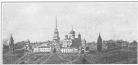
Вид Задонского Богородицкого монастыря в 1861 году

ны, получившей кушак из числа пожертвованной одежды.