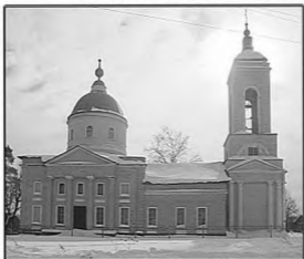
Храм в честь Рождества Пресвятой Богородицы. Современный вид.

Московских духовных школ — приходом иногда помогали семинаристы и учащиеся Регентской школы.