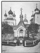
Соловецкий монастырь. Выдана открытка XIX века

Первоначально в 1836 году о. Иларию поставил перед Синодом вопрос о выводе из тюремного здания стражи. Свою просьбу он обосновывал тем, что в остроге караульной команде «быть неприлично, при том беспокобно и утеснительно для нее». Синод согласился с этими доводами. К 1838 году на арестантском дворе построили новое двухэтажное здание казармы, в которое вывели из острога иваланскую команду.