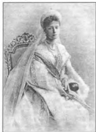
Царственная мученица императрица Александра Феодоровна Романова

Брак был частью замысла Божия, когда Тот создал человека. Это самая тесная связь на земле.