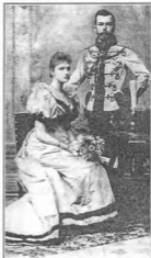
Цесаревна Николай Александрович и принцесса Алиса Гессенская после помолвки. Кобург, 1894 г.

Первым требованием к жене является верность, верность в самом широком смысле. Сердце ее мужа должно ей доверяться без опаски. Верная жена своим характером и поведением доказывает, что она достойна доверия мужа. Он уверен в ее любви, он знает, что ее сердце неизменно предано ему. Он знает, что она искренне поддерживает его интересы. Очень важно, что муж может доверить своей верной жене ведение всех домашних дел, зная, что все будет в порядке. Мотовство и экстравагантность жен разрушили счастье многих семейных пар.