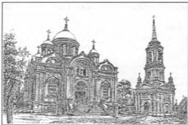
Завершение строительства Троицкого собора Свято-Тихоновского мужского монастыря. Гравюра XIX века.

отец Геронтий. Первоначально святые пребывали в кладбищенской Тихоновской церкви. Это был «серебряный» небольшой ковчег, в коем находятся несколько частиц святых мощей восточных и русских святых; над ковчегом устроен золоченный изящный baldachin, с переланной стороны его висят зажженные лампады, повешенные устаревшими».