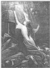
Крест — путь заблудшим, упование христиан, символ безомоных, надежда обуреваемых, утешение скорбящих, целебное даяние, безопасность вселенной, сила беснующих, утешение нищих, покаяние неволевающим... основание Церкви... Приклад крест, и престолы разорена (прп. Ефрем Сирин).

Интересно то, что в нашем доме по-прежнему было светло как днем, несмотря на то, что еще была ночь. Но теперь, после моего познания, в доме не было уже того беспорядка, который был до моего ухода. Все вещи стояли на своих местах.