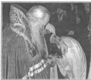
...постигает власи слъви о значимости ситуацийъ мира и всея же в мире и о отягчающе своемъ волнъ и всея плотиюшкъ познанийъ» (Монашеский трубникъ)

шую «пустоту» своими образами и представлениями – конечно же, самыми прекраснейшими. Фантастическая изобретательность касается всего: что должен представлять собой Рай, какими должны быть Святые, какими – бесы, что собой должен представлять монастырь, что – Церковь Христова, что собой представляет путь спасения вообще и