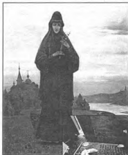
Портрет инокини Елены (Бехтеевой)

Этот гроб, обитый простым черным сукном, стоял в келии святителя, напоминая о краткости земного бытия, и свт. Тихон ежедневно над ним «в ночной тишине проливал немало слез и имел обновление отдыхать в нем после дневных трудов и подвигов, и просил окружающих, чтобы его в этом гробе и похоронили». На замечание иноков, что ему, святителю, непристойно в таком простом гробе быть похороненным, он всегда на одном настаивал, говоря, что если вы меня в сем гробе не похороните, я пред престолом Христа Спасителя буду судиться с вами. Когда же святитель заболел, то, предчувствуя свое скорое переселение