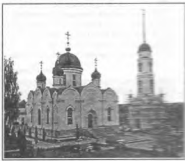
Спасо-Преображенский женский монастырь, г. Задонск.

Затем решили сходить в женский монастырь, до него, говорят, километра три. Плетемся себе потихонечку, и тут автобус. Видим: наши бегут, садятся – мы за ними. Поехали к дальнему источнику, что открылся по молитвам святителя Тихона, когда он молился в лесу. Идем по лесной тропинке, поем – теперь без Иисусовой молитвы никуда. Выходим из леса, и нам открывается чудесный вид. Монастырская стена – белая, сияющая, а за ней белый-белый храм с пятью черными куполами и золотыми крестами и белоснежная, пронзающая лазурь небес колокольня с горещицей на солнце крестом. Это Спасо-Преображенский женский монастырь. Заходим во святые врата. Ослепительно-белый собор, над входом барельеф, изображающий Святую Троицу. И кругом шесты. Трава такая шелковистая, блестяет на солнце. Райский уголок. Идем в собор (вход справа – в нижний храм; верхний, видимо, на реставрации). Внутри – все та же благодатная близина. И даже какой-то потолок не «давит». Очень красиво панорадило – с иконами и лампадами. Мощные колонны держат свод. Смотрим храмовую икону центрального алтаря – Иисуса Пресвятой Богородицы, сверху престольный праздник здесь. Служат