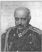
Киевский генерал-губернатор М. И. Драгомиров, оставивший воспоминания о рассмотрении императором Николаем I прошений по поводу открытия мощей св. Тихона Задонского

«Народ разбавлялся в своих поляхих о молитве и служении Творцу Небесному, поэтому — нужно остерегаться, как бы не вышло осквернения иконы чтимого на святой Руси обычая — делать, признавать и объявлять святым человека, прожившего весь свой век святой жизнью», — говорил царь».