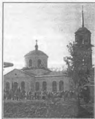
В селе Пилуша

После обеда – опять в колонну, и шагаем по дороге. И вот среди немощи нашей появляется дынок в полном облачении. Начинает кадить ряды – людям нужно укрепление. Так и шагает вокруг всей колонны, чтобы всем подать облегчение. Дым ладана действительно