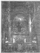
Внутренне убранство Владимирского собора г. Киева

Потом были и другие вразумления. Хотя я верующий с детства, но в школе участвовал в кружке духовного оркестра. Во время учебы в институте тоже принимал участие в художественной самодеятельности. Комсомольцем был. И часто бывало так, что с утра иду в церковь, а вечером