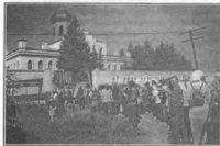
Молебен в селе Кони-Колодезь

Пришли! Наконец-то пришли! Связют золотом купола собора и золоченый шпиль с крестом. Начинается торжественный молебен.