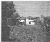
Одна из заброшенных келий Горы Афон

Поведав это братии, иеросхимонах Тихон добавил, что сам он и его духовный отец – ныне покойный иеромонах Тихон, русский иконописец, который подвизался в том же монастыре Симонопетра – при постройке были наречены в честь святителя Тихона Задонского. Затем священнослужитель