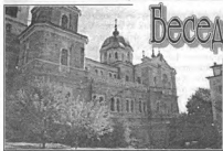
Андреевский свет. Гора Афон