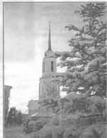
Колокольня Задонского мужского монастыря

Сегодня, время очень непостоянное, неопределенное и многое недоумевает: «Отчего идут войны, землетрясения, голод и моры? Как же так? Ведь Господь вновь родился, опять ангелы воспевают мир на земле, снова мы прославляем Пресвятую Богородицу и просим Ее: «Пресвятая Богородица, спаси землю Русскую!» А по местам такие настроения и беды! Почему такое творится? Для чего?» А происходят эти события для того, чтобы из миллионов людей спасти хотя бы несколько душ человеческих — то есть для нашего врачевания и исправления, для нашего покаяния. Мы знаем: человек злобный, немирный, живущий в пороках и страстях, не имеет возможности спасти свою душу. И только милосердием Божиим и по множеству молитв Церкви земной и Небесной приводится он к покаянию, исправлению и ко спасению.