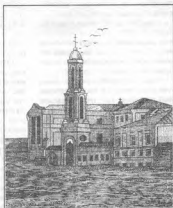
Зерковское подворье Тихоновской странноприимной общины (с литографии XIX века)

2) церковь в странноприимном доме разрешить святить теперь же, с тем, чтобы служба в одной исполнялась одним из городских причетов;