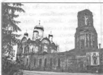
Архангельский храм, г. Елец. Фото 2003 г.