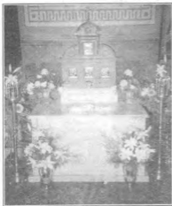
Гробницы Задонских праведников во Владимирском соборе

костей, а затем, на одном уровне, – 11 костяков и находившихся в одном месте остатки одежды, обуви, некоторые по ребельные принадлежности. По всей видимости, вещи, извлеченные из склепов,