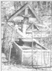
Святая могила на Задонском кладбище