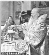
Божественная литургия во Владимирском соборе Задонского Рождество-Богородицкого мужского монастыря

кой и тех предводителей, которые увлекли людей на столкновение друг с другом, участвовали в разрушении всего святого на Руси. Нужно возносить о них молитвы не только в эту Троицкую родительскую субботу, но