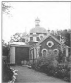
Древал-Успенская церковь Поройской Пустыни в г. Липецк