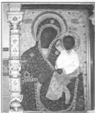
Икона Матери Божией «Тихвинская» в Вознесенском соборе г. Ельца

будь-осуждал. Перед смертью он жит в отдельной келии и творил Иисусову молитву. У него любовь была ко всем неопишеская. Строгости инва-