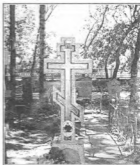
Могила старца Иоанна на кладбище Турбинского завода г. Липецка

На блаженном Иоанне в полной мере исполнились слова из Святого Евангелия: “Аще зерно пшеничное пад на землю, не умрет, то едино пребывает; аще же умрет, много плод сотворит” (Ин. 12, 24). Приходивших к нему блаженный Иоанн учил умирать ради греха и возрождаться в жизнь вечную. Подвиги самоочищения, с Божьей помощью подымаемые в земной жизни старцем, понятны и близки всему православному народу, ибо своим житием он показал, что, живя в миру благоочестиво, можно спасти душу, и на примерах своей справедливой жизни он учил, как этого достичь.