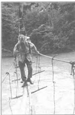
Перехрещивая через голую реку

А евангельской слепец еще больше кричал. И когда Христос его по-