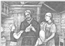
Вся семья вместе – и душа на месте

новятся основой и в жизни детей, через исповедь дети учатся ответственности за свои поступки, учатся трезвенно, контролю над своими мыслями, желаниями, делами, учатся доброте. Причастие освящает, просветляет детей, наполняет души их радостью, легкостью, это общение с Богом делает ребятных счастливейшими из людей.