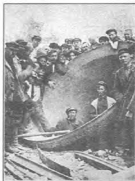
«Отец наш, и не веди нас во искушение» - Лк. 11,4

здесь нет. Но Господь сказал: « Распитание и множится, и наполните землю » (Быт. 1, 28). Он говорит нам «рождайте», а мы убиваем. А когда приходит час расплаты, мы в ужасе, в большом смущении. Но святые отцы говорят: «Лучше, Господи, меня здесь накажи, не жли там». Там будет расплата невообразимая для нас. Это страшная участь пленника, когда демоны всю силу