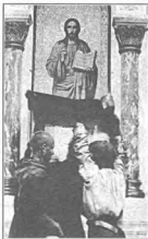
«Отче, отпусти им, не ведают бо, что творят» (Лк. 23,34)

вотному миру. Недаром старцы исповедывались даже в таких грехах: «Сломал веточку на дереве без всякой причины. Сорвал цветок, бросил. Выбросил недосаженную булоч-