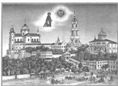
Свято-Успенская Почаевская лавра

– Нельзя к вам повернуться: у вас диавол за спиной. Дайте, я пойду, его сорву, изорву на кусочки и выкину. Тогда к вам повернусь.