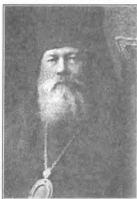
Святомученик Сергий (Зверев), архиепископ Смоленский