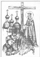
Быть матерью - это долгий крест

Очень я боюсь раздражения, озлобления. Так хочется, чтобы в нашей семье был мир.