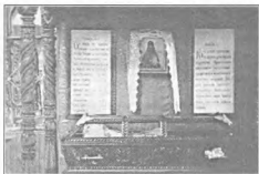
Рака с мощами святителя Иннокентия в Преображенском кафедральном соборе г. Одессы

он начал священнослужение свое в Одесском соборе. В день Святого Духа он скончался. Духу Святому он молился молитвою святого Симеона Нового Богослова».