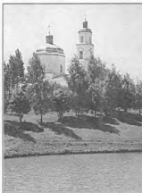
Волынский храм в селе Бурдино

— А что ж ты боишься? Вот Матерь Божия, — показывает. А у них там стоит икона во весь рост. — ...А ты боишься!..