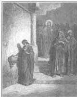
Рада бед, ищут, воздыхают, И востают, Господь говорит, И поставлю адан от страданий Содержания смиреня в стел.

«Оставил времена неведения, Бог ныне повелевает людям всем повсюду покаяться!» (Деян. 17, 30). Прежде же чем покаяться, нужно сначала прийти к покаянию через слышание слова Божия от проповедника-пастыря, или катехизатора, или еще какого опытного учителя православной веры. Только от слышания опытного слова, растворенного солью благодати Божией, может войти в сердца людские и