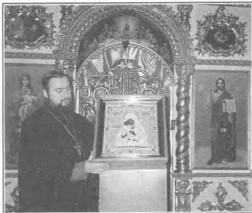
Перед чудотворной Владимирской иконой Божией Матери