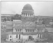
Владимирский собор Троекуровского монастыря (современный вид)