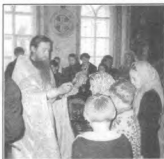
Благословение на начало учебного года

Одни заботятся в основном о том, чтобы их дети хорошо питались и росли здоровыми, другие – стараются всего более дать детям хорошее образование, третьи – все усилия прилагают, чтобы развить в детях таланты и мечтают увидеть в них прославленных ученых, художников или музыкантов. А о вечной участи детей мало кто из родителей думает. А надо воспитать