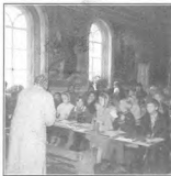
Первый урок в новом году

тели этих деток сами чаще всего о Боге, Церковь, молитве, причастении, почти ничего не знают и, конечно, своим детям ничего о нем почти ничего рассказать об этом не могут, объяснить не могут, насытить их потребность в общении с Богом не могут. А диавол не дремлет и заливает создавшуюся в душе ребенка духовную пустоту семечками зла. И вырастают детки с искаженной душой и идет «наперекосом» вся их жизнь. Душа их искала Бога, но не нашлось человека, который открыл бы им путь к Нему. Вот поэтому, когда монах или послушник в черном подряснике приходит на урок в школу, детки готовы его обнять и рассказать, ведь это не монах к ним