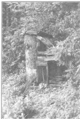
Келья для уединения (липовое дупло)

...Другой раз он служит молебен, болящая там стоит. Я стою сзади, так чуть-чуть немножко в сторонке. И смотрю: клоч волос при нас падает к отцу Виталию сзади. Ой, у меня волосы дыбом встали. Я так испугалась! Я б могла вот так поднять голову и увидеть направление руки... стояло так человек пять, наверно, но я до того испугалась! я сейчас так говорю — и меня в дрожь... До того