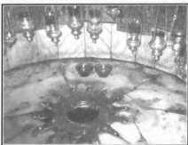
Вифлеем: Базилика Рождества

В то время люди верили, что при рождении великого человека появляется на небе новая звезда. Волхвы пришли очень издалека, с востока (из Персии или Вавилонии), поклонились Богомладенцу до земли и от всего сердца поднесли ему свои дары, по нашему подарке: золото, ливан (ладан) и смирну (драгоценное благовоное масло).