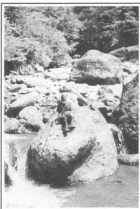
«В пустыню обычно идут, считая, что там нечего делать...»