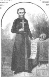
Почтен. затворник Задонский

«Письма задонского затворника Георгия», «САТНЦь» Санкт-Петербург, 199.