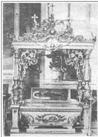
Вид раки свт. Тихона Задонского в г. Орле

перед ящиком. Его старались задвигать подальше. Но сотрудники могут и не появляться часто в фондах. Иное дело я. Фонд — мое рабочее место. Придешь на это место утром, открываешь дверь и невольно застываешь, потому что слышишь отчетливо за