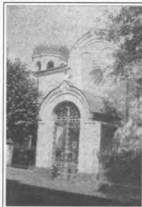
Храм в честь св. благоверного князя Александра Невского в г. Тбилиси