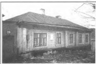
Дом братьев Фроловых на улице Урицкого

ного монастыря. С учетом дальнейшей судьбы этого настоятеля, можно предположить, что перевод в трехклассный Задонский монастырь был своего рода испытанием в чем-то провинившегося архимандрита. Согласно тому, что сообщает о. Геронтий об этом настоятеле в биографии Христа