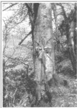
На монастырской тропе. Разросшийся крест, вырубленный в свое время на стволе дерева монахом-пустынником

Ответ: Так и хочется тебе создать рай еще на земле. Но не в своей душе, а именно в обществе, хотя и маленьком.