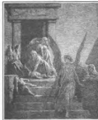
Поклонение первенца в Египте

В ту пору жил в Иерусалиме праведный старец Симеон, дождавшийся пришествия в мир Спасителя, дождавшийся не как прочие люди, а вследствие особого ему обещания, что он не умрет, пока не увидит Христа Господня. Когда Дева Мария и Иосиф принесли в Храм Иисуса Христа, старец Симеон по внушению Духа Святого пришел туда тоже, встретил Гос-