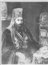
Митрополит Евгений (Большаков) (1767—1837)

Особенно, по мнению современников, чудодейственная сила святого образа проявилась в леде для законца года. Так, в 1830-1831 годах, когда Воронежскую губернию постигла эпидемия холеры, Задонский монастырь избежал общей печальной участи. Заболевшие были и в его стенах, но обобщало, ко всеобщему изумле-