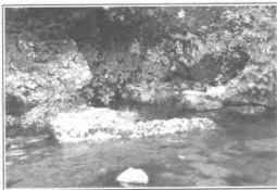
Источник св. ич. Висловск в Камнях

человек его и не заметил, но дело он начинает портить. Оно его уже отгоняет, он начинает роптать на всех и вся, он – в раздражении. Если его ругают, что испортил дело, он впадает в уныние, расслабление, апатию, и может дойти до большого расстройства в жизни: «Как мне это уже надоело!.. Надо что-то изменить...» и т.д. А фактически все очень просто – он питает свою страсть, за которой идет уже целая цепь последующих грехов.